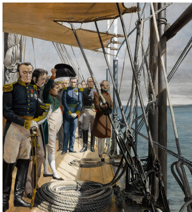
Adieu, ma belle France

le 12 juillet, sur l'île d'Aix, dans le logis du commandant de la garnison. Deux frégates de l'escadre de Rochefort, la Saale et la Méduse , ancrées dans la rade de l'île d'Aix, ont été préparées pour le transporter en Amérique avec sa suite et ses volumineux bagages. Bloqué sur l'île d'Aix, Napoléon comprend bientôt que Fouché, le ministre de la Police, a remis son sort aux Anglais. Récusant les plans d'évasion qui lui sont proposés, il fait porter à Londres par son aide de camp, le général Gourgaud, sa lettre de reddition au Prince Régent d'Angleterre, puis, le 15 juillet, il embarque à bord du vaisseau anglais le Bellérophon , première étape d'une navigation de quatre mois qui finira par le conduire à Sainte-Hélène.