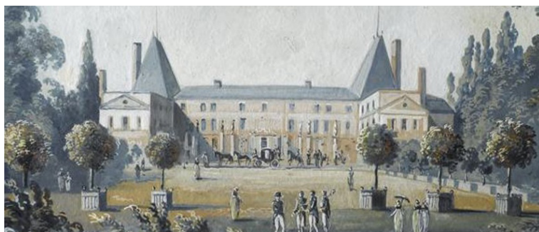
Coffret orné d'une aquarelle représentant la vue du château de Malmaison

Après son abdication, le 21 juin 1815, au lendemain de Waterloo, Napoléon demande à s'exiler aux Etats-Unis. Contraint par le gouvernement provisoire de s'éloigner de Paris, il arrive à Malmaison le 25 juin. Il avait reconnu à l'Impératrice la pleine propriété du domaine au moment du divorce et le château, maintenant plongé dans la solitude depuis la mort de celle-ci survenue le 29 mai 1814, avec ses allées ombragées de tilleuls, fait figure de havre. L'Empereur attend en vain que les Alliés statuent sur son sort et consentent à lui délivrer les laissez-passer dont il a besoin pour partir. Le 29 juin, Napoléon prend la route de Rochefort et s'installe,