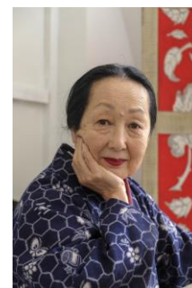
Portrait de Setsuko Klossowska de Rola