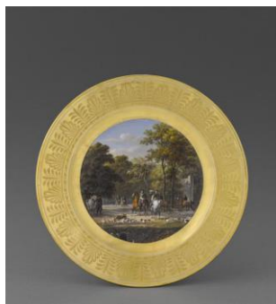
Assiette : Chasse au daim dans le bois du Butard, 1808.