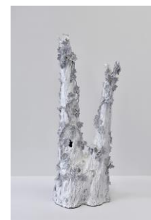
Montée / Setsuko