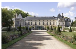
Château de Malmaison : façade côté cour

Photos HD sur demande : sophie.chirico@culture.gouv.fr