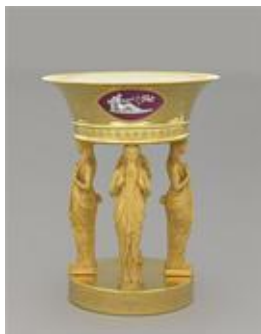
Corbeille du service à dessert de l'impératrice Joséphine

Manufacture dite du duc d'Angoulême - Dihl et Guéhard