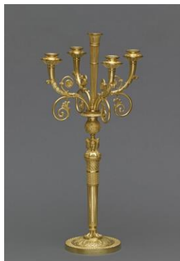
Candélabre, Bronze doré, 19 e siècle