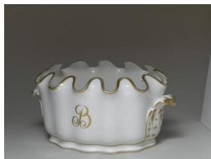
Rafraichissoir en porcelaine / Château de Malmaison