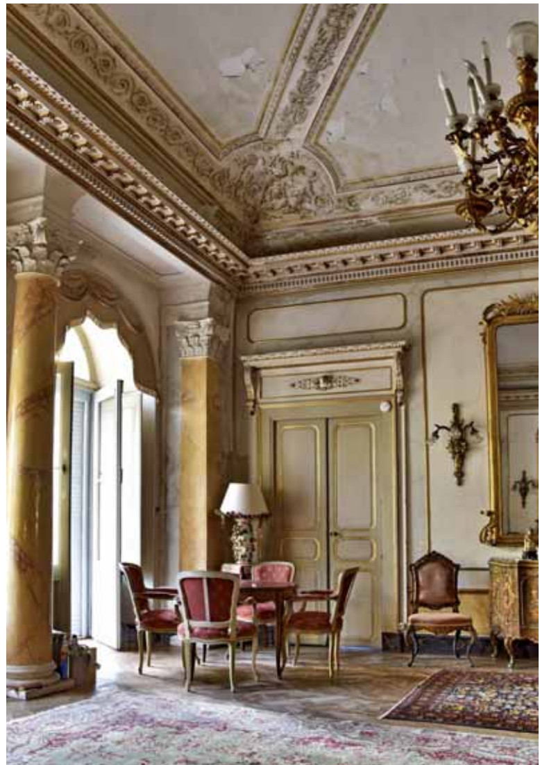
AJACCIO Grand salon du château Corti

Jean-Marc OLIVESI - rsque le directeur d'un grand musée corse nous a dit : « Après l'ouvrage de référence sur le mobilier en Corse, voici celui sur les grandes demeures », nous avons été très contents, mais il faut bien se dire que sans l'aide des musées de l'île, du service de l'inventaire de la Collectivité de Corse, de la passion des chercheurs insulaires qui mettent à notre disposition dix, vingt ans d'enquêtes sur le terrain ou en archives, tout cela n'aurait pas eu lieu ! La prochaine étape ? Un peu de suspense sied aussi aux musées ... ■