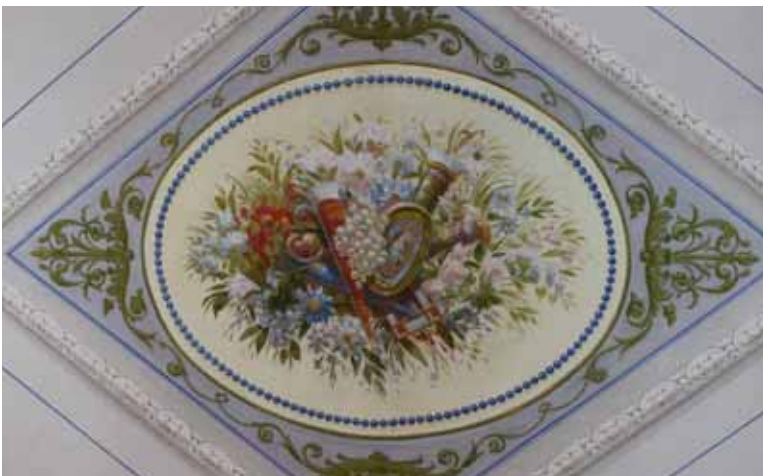
Décor peints de la Maison Bonaparte, 1857

bandeaux, fenêtres à fronton ... ( la maison Bonaparte par exemple ). C'est une construction dont la taille, la massivité affirment l'origine patricienne ( Les Bozzi par exemple ) et racontent les racines profondément corses.