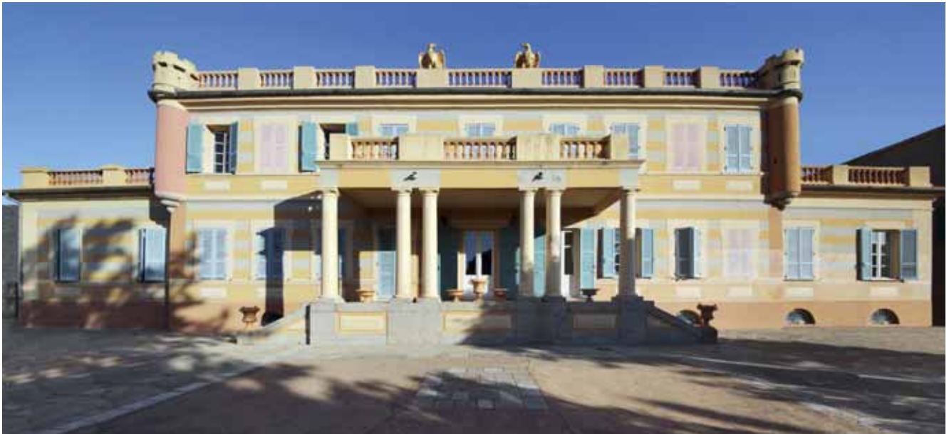
AJACCIO, Entrée à portique formant loggia vers les jardins, château Baïocchi

ARIA - L'exposition qui va ouvrir le 9 octobre prochain à la Maison Bonaparte mettra en perspective les documents recueillis et les aquarelles de Pierre-Alexandre Soulat, en écho à l'ouvrage paru : la synergie catalogue / exposition vous semble-t-elle désormais indispensable pour sensibiliser ou conquérir de nouveaux publics ?