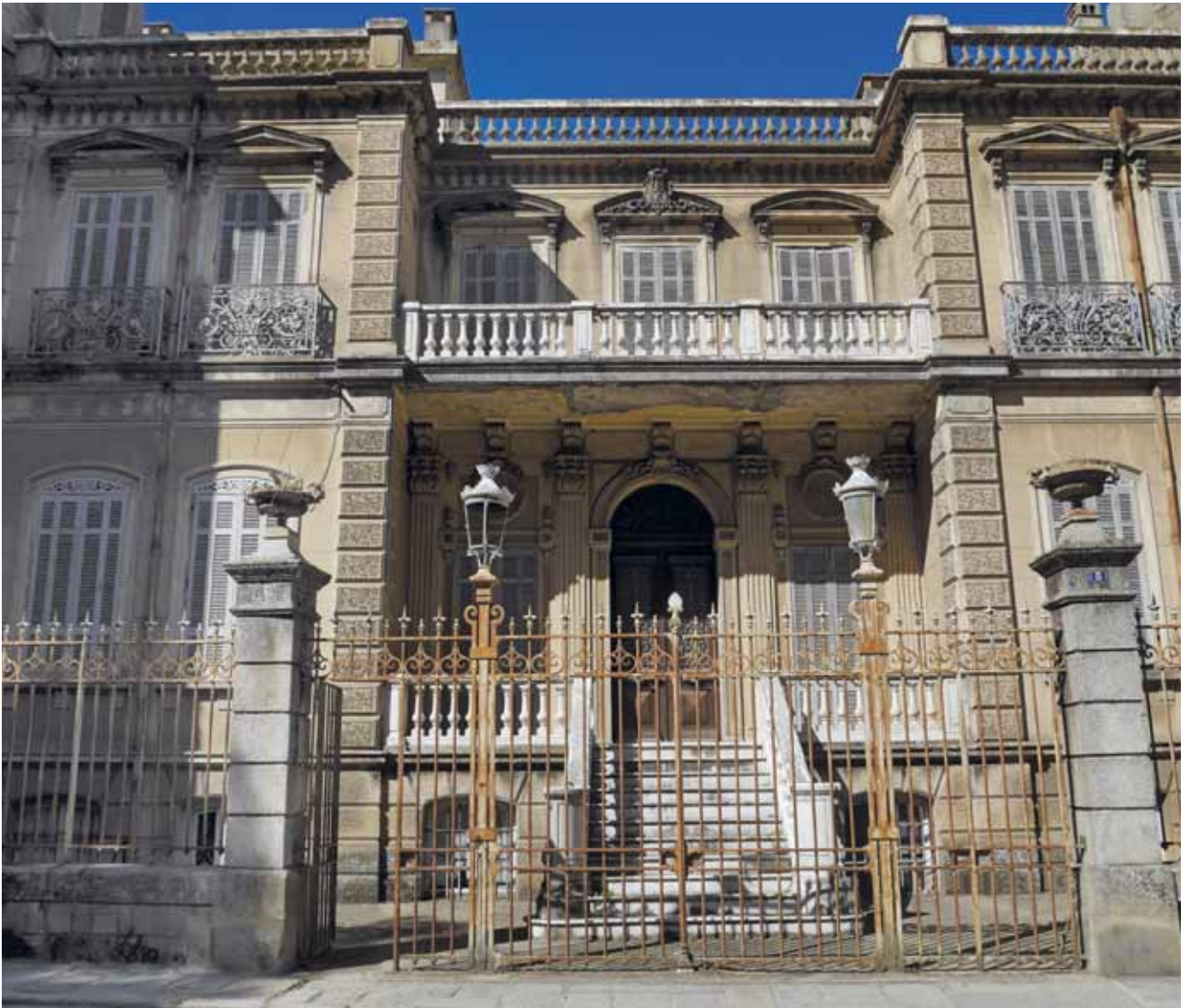
SARIÈNE, Élévation principale de l'hôtel particulier de Philippe de Rocca Serra © Adey GUVAN