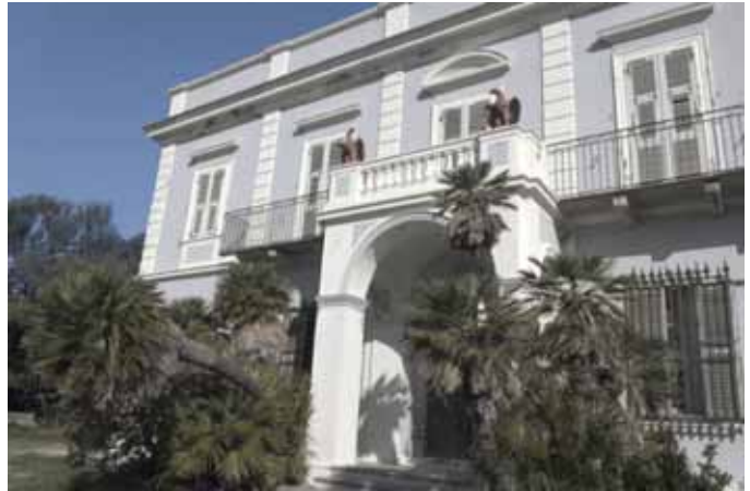
CENTURI, Château Scipione

ARIA - De quelle manière avez-vous travaillé, notamment pour l'iconographie et la collecte des documents ? Avez-vous rencontré des difficultés au cours de vos recherches, ou fait des découvertes surprenantes ?