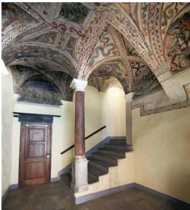
BASTIA, Départ de l'escalier de la maison Castagna

qui émaillent l'ensemble du territoire insulaire d'Ajaccio à Bastia en passant par Bonifacio, Sartène, Corte, la Balagne ou encore le Cap Corse. Abondamment illustré, le catalogue bénéficie de très nombreuses contributions, auxquelles les dessins et aquarelles de Pierre-Alexandre Soulat apportent précision et raffinement. L'ouvrage offre ainsi un éclairage complet sur un aspect méconnu du patrimoine insulaire : l'architecture civile. Entretien avec Jean-Marc Olivesi, Conservateur Général du Patrimoine, Musée National de la Maison Bonaparte à Ajaccio.